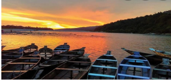
Boats on the river

place to hop around, summer afternoon are often sweaty, which makes it uncomfortable. Monsoon: June-October Meghalaya receives the maximum rainfall during this time. It has the two