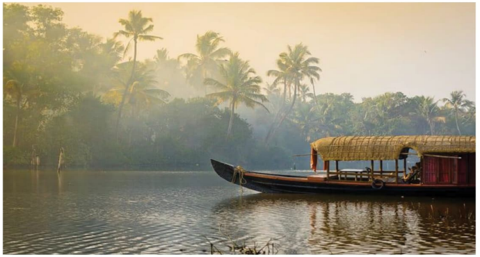
A houseboat sails on Kochi backwaters