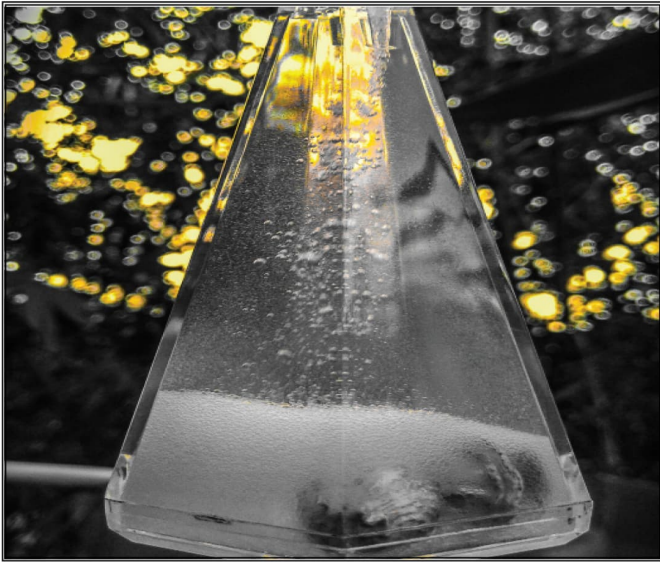
সময় বয়ে চলে - মৌসুমী দাস