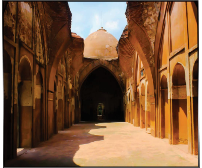
অবশিষ্ট ইতিহাস - মৌসুমী দাস