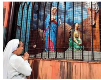
Churches in Kolkata to reopen soon

Catholic churches in the city have decided to take care of elderly parishioners. Small groups of young members of the church will be formed so that they could visit every aged citizen. Due to the pandemic the senior citizens could not visit the church, so the church itself is trying to reach out to them. This is the gist of the circular that has gone out to parish priests from Archbishop Thomas D'Souza, as he permitted all 65 churches under the archdiocese of Kolkata to re-open with extreme caution.