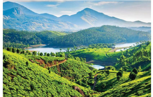
The hills are a big draw for tourists

Munnar is its surrounding hill station that is a must visit. Comparatively, the climate of Munnar is more pleasant than the other places of the state. Munnar is known to be one of the most sought after tourist destinations in South India due to its pristine