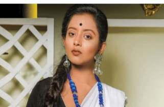
Bengali actress Shruti Das