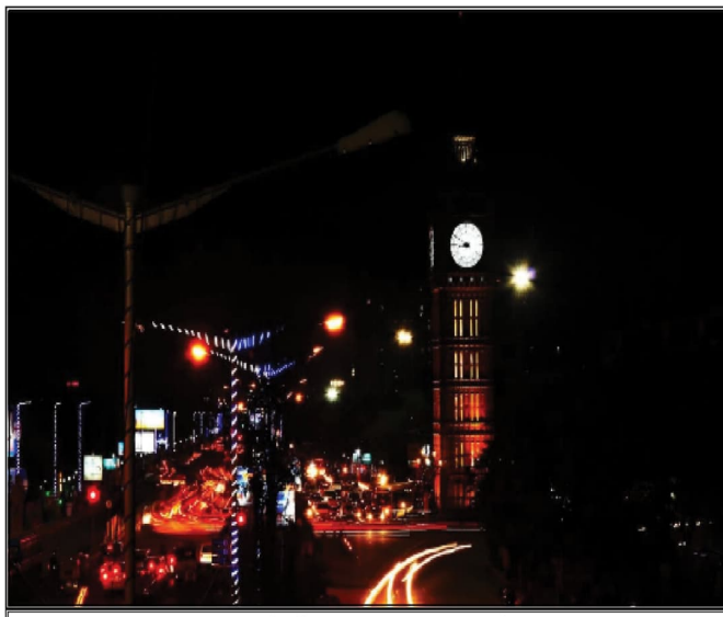
Night lines- Kaustav Deb